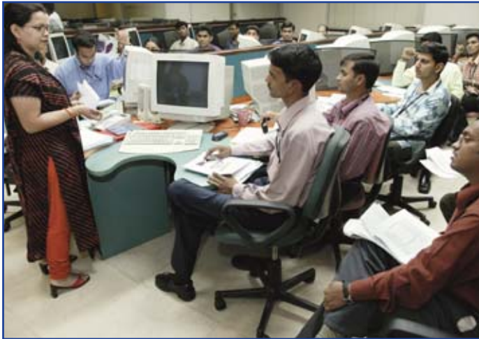
Formación de nuevos empleados: Infowavz Mumbai, India.

Ya está bien establecida la tendencia a que los puestos de trabajo en el sector de los servicios se reubiquen allende las fronteras nacionales. La India y China ocupan los titulares de la información sobre el particular, pero algunos de los principales receptores de estos puestos de trabajo se encuentran en lugares mucho más cercanos. Por otra parte, hay otros países en desarrollo -como las Filipinas- que están estableciendo su presencia en la industria mundial del servicio a la clientela.