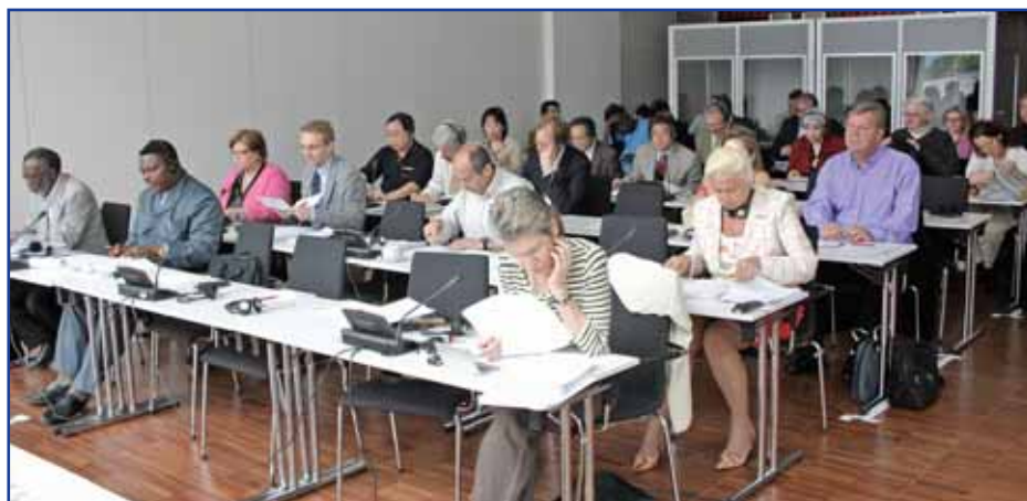
UNIs verkställande utskott i Wien granskade framsteg med globala ramavtal med multinationella företag

Att övertyga ett multinationellt företag att åta sig att respektera arbetsrättigheter och hållbara miljönormer är ett viktigt steg i rätt riktning. Men det är bara ett första steg framåt. Globala ramavtal är en utgångspunkt från vilken nationella förbund kan arbeta vidare - och de måste följas upp.