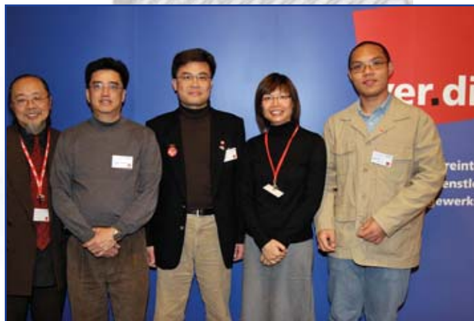
Fackliga företrädare från Hongkong under Leipzigkonferensen

I oktober 2006 inleddes flera nya projekt med en intensivutbildning av ett ungdomligt arbetslag av organiserare – som stöds av huvudorganisationen HKCTU i Hongkong och av SEIU i USA. De inriktas på anställda på Disneys nöjesfält, samt på väktare, städpersonal och handelsanställda. Projekt för ytterligare grupper av arbetstagare övervägs. Många av dessa arbetstagare har mycket låga