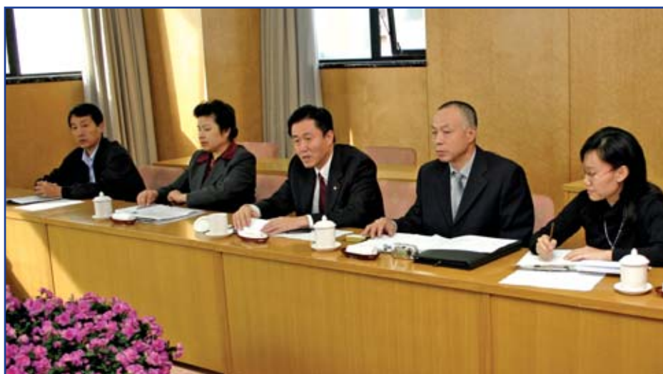
ACFTU-panel i Beijing: UNI Grafiska träffade representanter från avdelningen för lätt industri i Kinas fackliga huvudorganisation