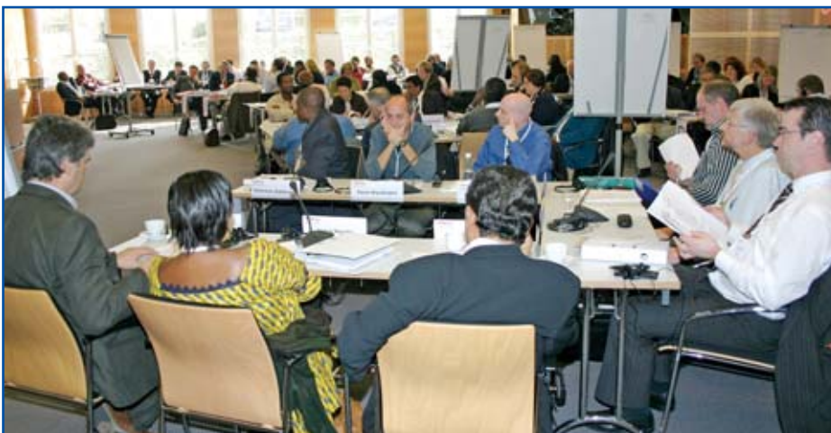
UNI-styrelsen sammanträder i Nyon

Under sitt möte i Nyon i november 2006 ställde sig UNI-styrelsen bakom en rad åtgärder för att organisera och knyta band mellan fackföreningar runtom i världen och arbetstagarorganisationer i Kina - och för att utveckla fackföreningarna i Asiens andra snabbväxande ekonomiska gigant, Indien.