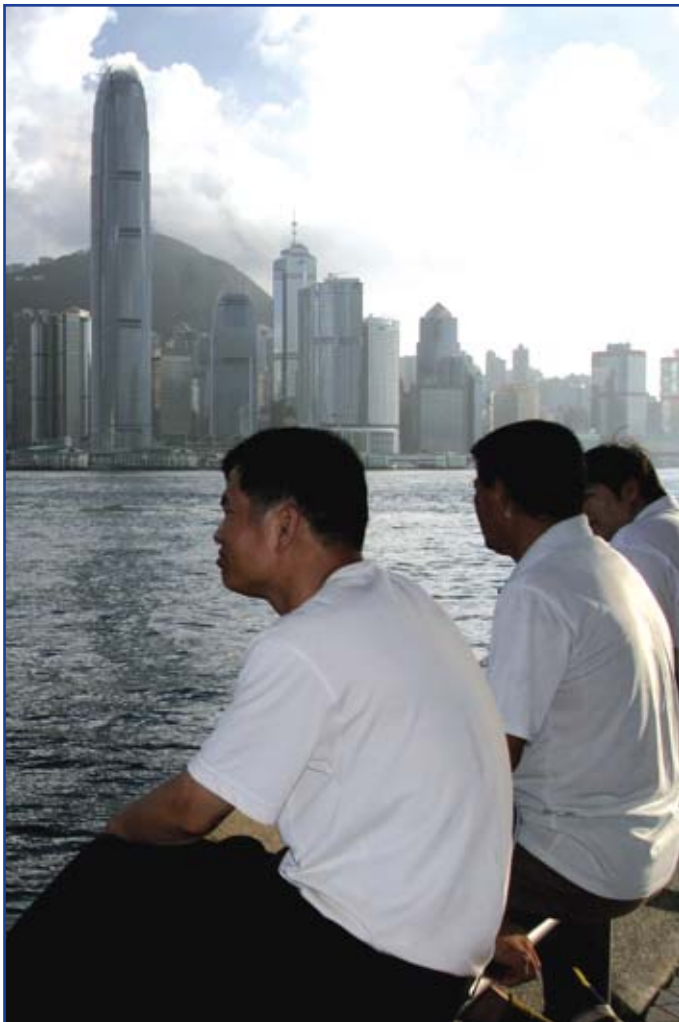
Hongkong är ett viktigt mål i UNIs organiseringsprojekt