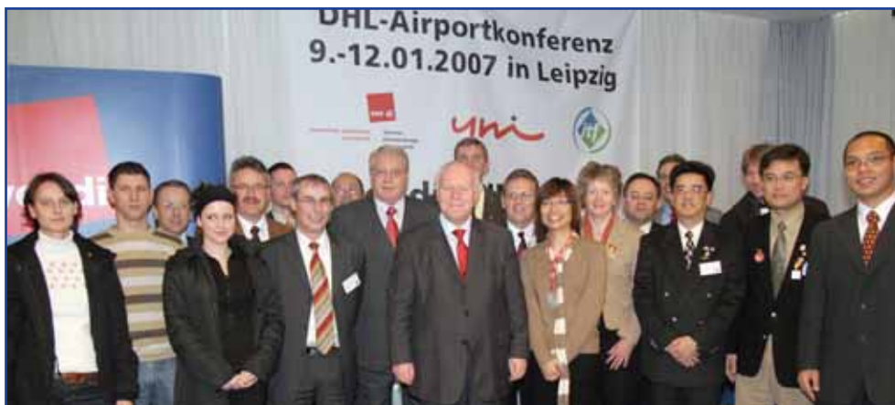
Dr. Georg Milbradt, Sachsens Ministerpräsident, trifft DHL-Gewerkschaften aus Deutschland, den USA and Hongkong