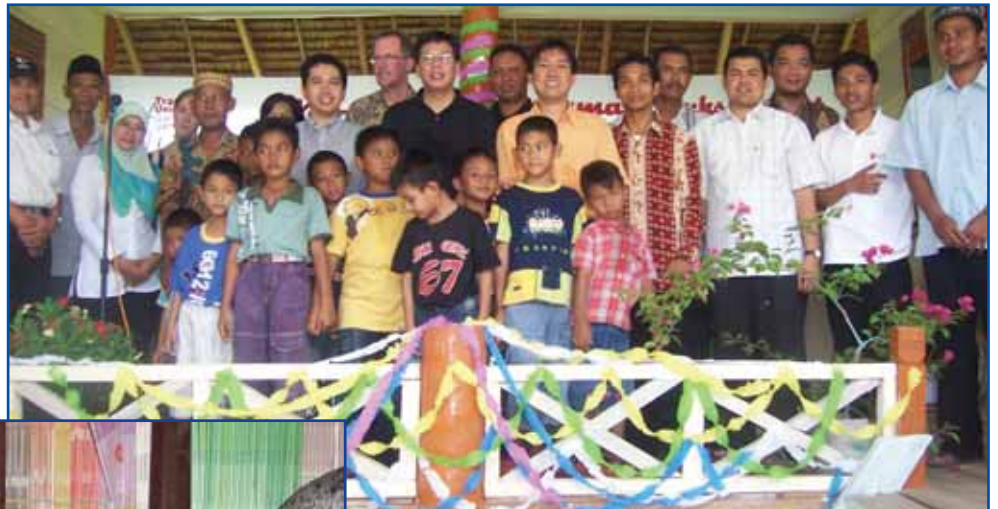
Eröffnungsfeier im Cot Suruy-Gemeinschaftszentrum

Die von UNI-Asia Pacific und SASK Finnland unterstützte 'Trade Union Care Center Foundation' plant ein weiteres Gemeinschaftszentrum in dem vom Tsunami betroffenen westlichen Aceh. Solche Zentren gibt es bereits in Calang und Cot Suruy, wo kürzlich Computerkurse für indonesische Ausbilder organisiert wurden. Meulaboh gehört zu den Bezirken, in denen der Tsunami im Jahr 2004 die schlimmsten Schäden anrichtete. Mit dem neuen Gemeinschaftszentrum soll eine Bildungs- und Ausbildungsstätte für Kinder und Erwachsene in sechs Dörfern geschaffen werden. (uni-asiapacific@uniglobalunion.org)