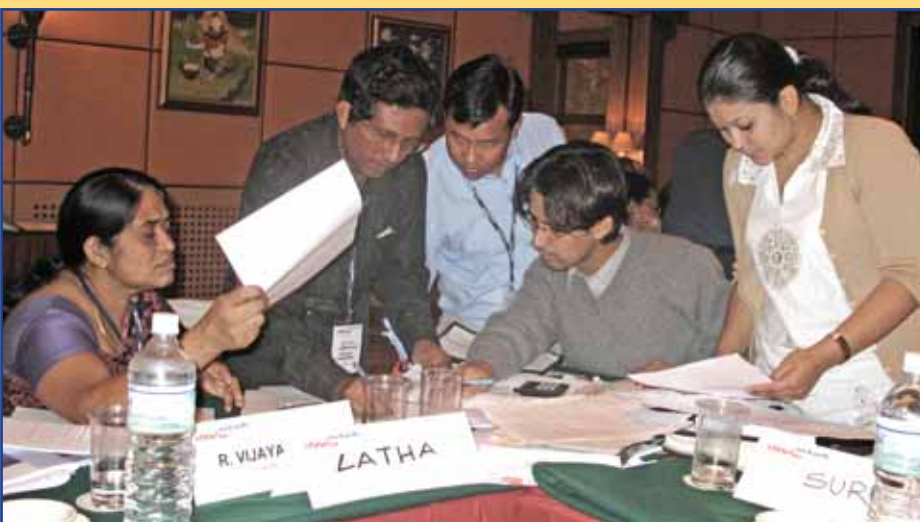
Empowerment-Workshop in Nepal

Tarifverhandlungen standen im Mittelpunkt eines Lehrgangs für Gewerkschafter, der vom 19.-22. Dezember in Vietnam organisiert wurde. In einer zentralen Planwirtschaft können Gewerkschaftsvertreter nicht an Lohnverhandlungen mitwirken, doch waren die 31 Teilnehmer sehr daran interessiert, sich mit Tarifverhandlungen vertraut zu machen, da das kommunistische Regime ihres Landes seinen behutsamen Weg in eine frei Marktwirtschaft fortsetzt. Sie erfuhren, wie eine Forderung formuliert und darüber verhandelt wird, und sie verglichen malaysische und vietnamesische Tarifverträge (besucht: uniglobalunion.org/drd ).