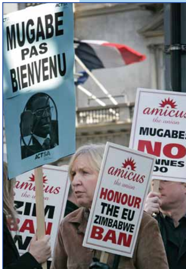
Amicus protestiert vor der französischen Botschaft in London gegen die Einladung des simbabwesischen Präsidenten Mugabe an den Gipfel der französischsprachigen Länder in Cannes

Der hohe Gerichtshof Koreas hat kürzlich eine Entscheidung getroffen, die Wanderarbeitern - ungeachtet ihres Status - erlaubt, Gewerkschaften zu bilden und diesen beizutreten. Das bedeutet, dass Arbeitnehmer ohne Papiere Gewerkschaftsmitglieder werden können, was vom Migrant Forum in Asien begrüßt wird. Es wird erwartet, dass die Regierung diesen Fall vor den obersten Gerichtshof bringen wird. (uni-asiapacific@uniglobalunion.org)