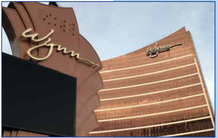
Das US-Kasinounternehmen Wynn ist bereits in Macau etabliert

UNI-Asia Pacific Spiele und Wetten wird im Juni in Macau tagen - dem heute größten Spiel-Zentrum der Welt. Diese Veranstaltung, an der eine globale Teilnahme erwartet wird, fällt mit einer asiatischen Fachmesse in der Stadt, nunmehr ein Sonderverwaltungsgebiet Chinas, zusammen. Fast 50% der Erwerbstätigen in Macau arbeiten in der Spielindustrie, und UNI beabsichtigt, mit Hilfe des UNIdoc in Hongkong ein Projekt zur Organisation dieses Personals einzuleiten. (alke.boessiger@uniglobalunion.org)